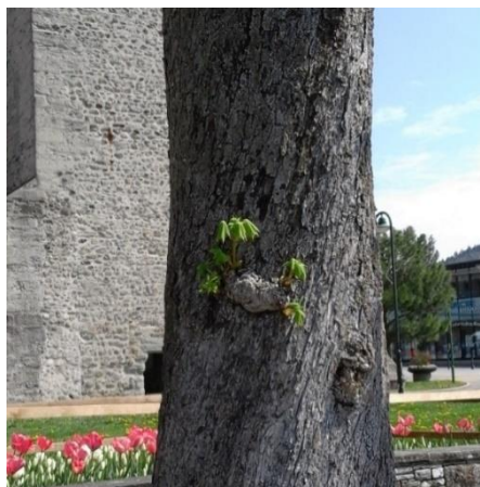
Jeunes pousses d'un vénérable marronnier Photo LP - Moudon/VD - Avril 2020