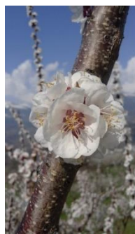
Abricotier en fleurs - Baar - 11.03.2020

Si C.I.= Ujjayi Anuloma 6 cycles avec concentration sur le son du souffle