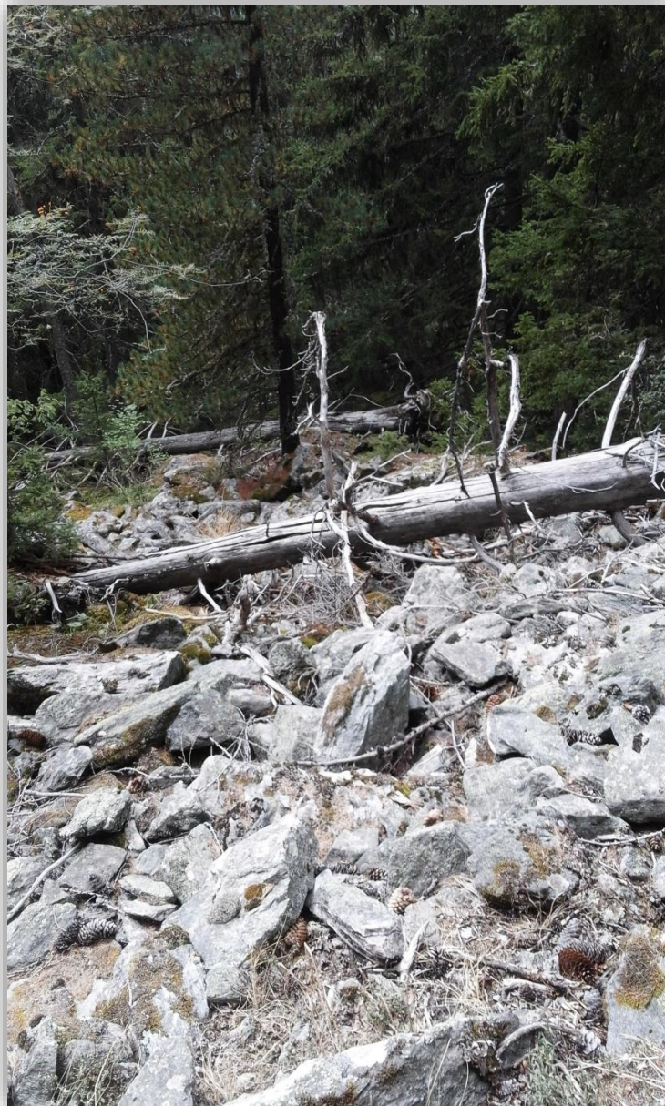
Eison-Fourcla - Val d'Hérens - Août 2022