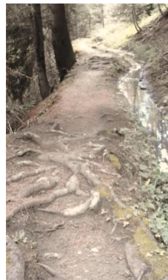
Petit bisse Zanfleuron - 08.2022

Poursuivre son chemin, obstacles après obstacles, pour aller vers la lumière...