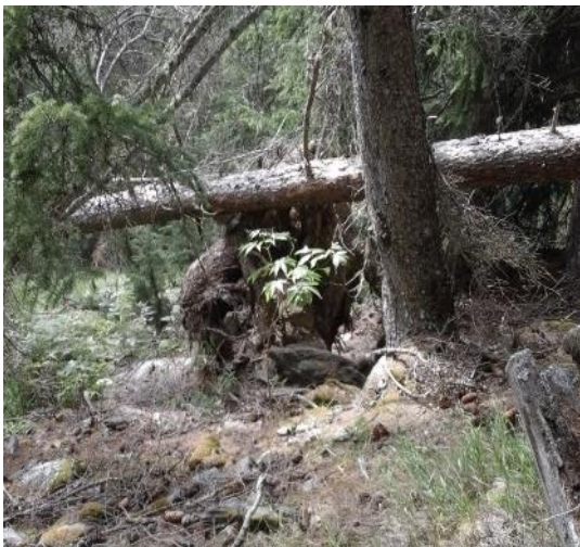
Eison - Val d'Hérens - Août 2022

Afin d'y voir plus clair, il s'agit juste d'avancer, pas à pas, dans un tri sévère pour ne garder que l'essentiel, à l'instar des pierres édifiant les cairns... Encore faut-il savoir les choisir aux formes, dimensions et poids adéquats qui permettront à la superposition précise de garder centre et verticalité dans la durée.