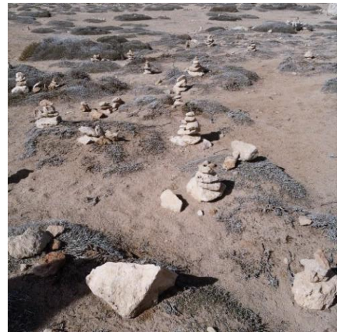
Chypre - Octobre 2018