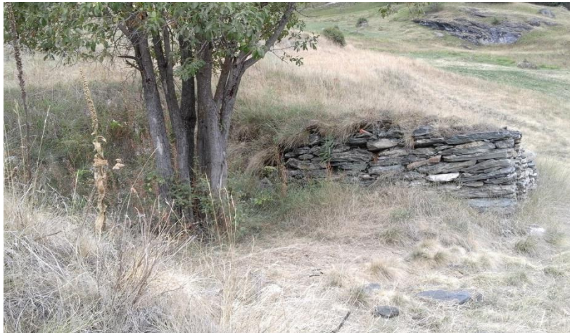
La vie reprend ses droits - 08.2022